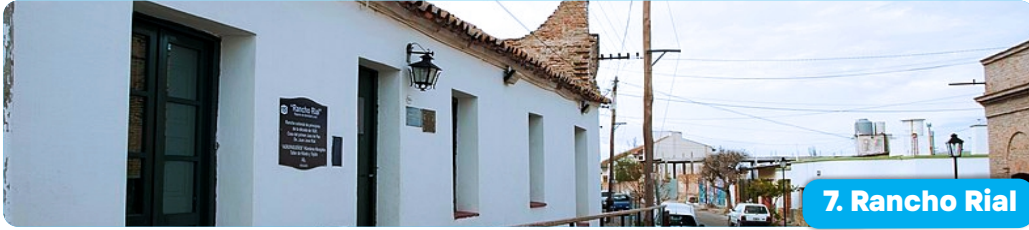
7. Rancho Rial