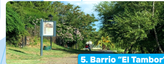
5. Barrio "El Tambor"

En ese sitio estuvo emplazado desde 1779 el muelle y luego puerto, llamado "Nacional". Tiene forma de "T" emergente, mide 33,45 metros de largo por 5,30 metros de ancho, y su profundidad mínima al pie es de 5 metros. Fue habilitado como "puerto menor" el 21 de julio de 1810. Originalmente estaba hecho totalmente de madera. En 1922, es reconstruido. En 1952 el Ministerio de Obras Públicas, levanta el servicio de navegación fluvial, con lo que el muelle queda, hasta la actualidad, limitado al transporte público de pasajeros. La última renovación fue inaugurada en 2016, y desde ese entonces tiene, además, una pasarela con baranda de hierro perimetral y plataforma flotante.