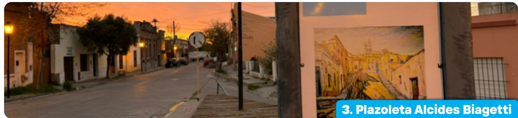
3. Plazoleta Alcides Biagetti

Esta construcción data de fines de siglo pasado siendo uno de los más representativos testimonios de la época de mayor esplendor económico de Patagones. Puede situarse entre 1880 y las vísperas de la primera Guerra Mundial. Fue construido por la familia Sassenberg antes de la inundación de 1899, y adyacente a lo que fueron sus magníficos jardines, se levantaron dos enormes barracas, en las que se acopiaba la lana, cuyo destino final era Europa. La familia Landalde llega a quedarse con la casa por una deuda de juego en una mesa de póker. Ellos la habitaron hasta la década del '40. Hoy en día, se encuentra en manos privadas y no es posible su acceso interno.