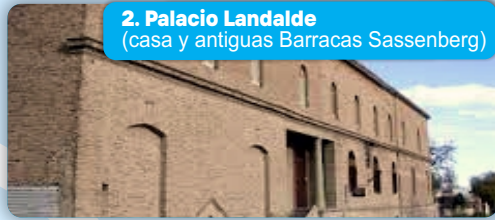
2. Palacio Landalde (casa y antiguas Barracas Sassenberg)

Sitio Histórico Nacional. Aquí supo estar la casa natal y el comercio de los padres de Don Luis Piedra Buena. Lamentablemente, la inundación de 1899 se lleva consigo las estructuras. Marino ilustre, rescatista de naufragos, y defensor de nuestra soberanía austral. La importancia de Don Luis queda plasmada por su vida y su dedicación por defender nuestro país, sin pedir nada a cambio. Actualmente, sus restos, y los de su esposa Julia Dufour, descansan en el Mausoleo, dentro de la parroquia Nuestra Señora del Carmen.