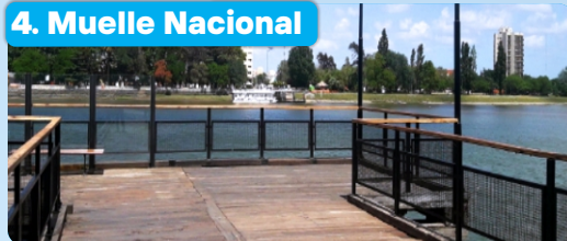
4. Muelle Nacional