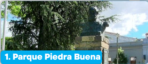
1. Parque Piedra Buena